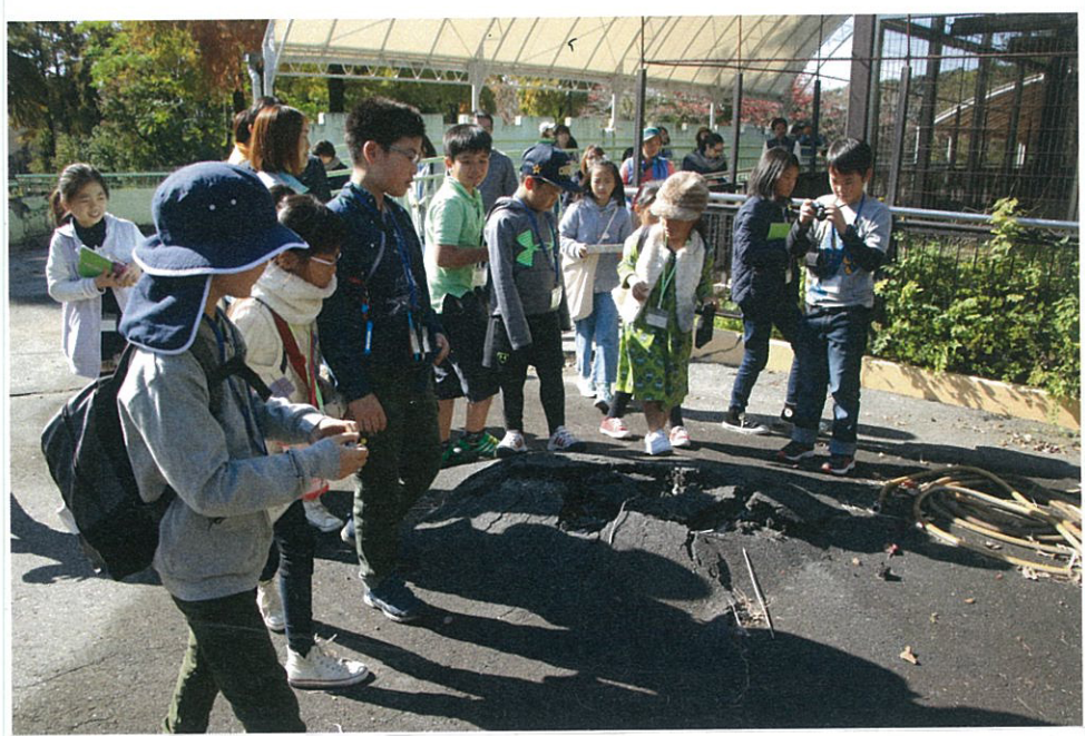
キンシコウの木黄の道路が盛り上がりてひびか われていた場所