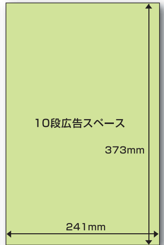
各版の部数と広告料金表(2014年1月現在)