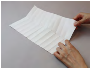
④一度開き、山折り・谷折りの指示にあわせて折ります