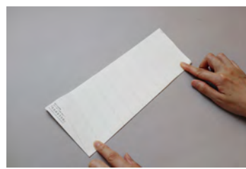
③真ん中の線を一度山折りし、定規を当てながら折り筋をつけます (折り筋をつけてから折ると仕上がりがきれいになるよ!)