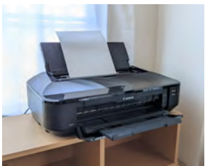
①型紙を拡大コピーするか、ダウンロードしてA4で印刷します