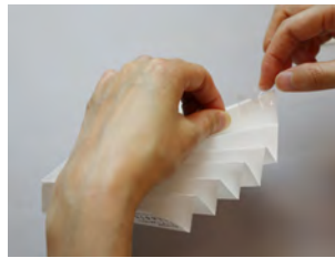
⑤テープをはる部分をセロハンテープでとめます。(本体は●印を裏から、留め具は表からとめてね)